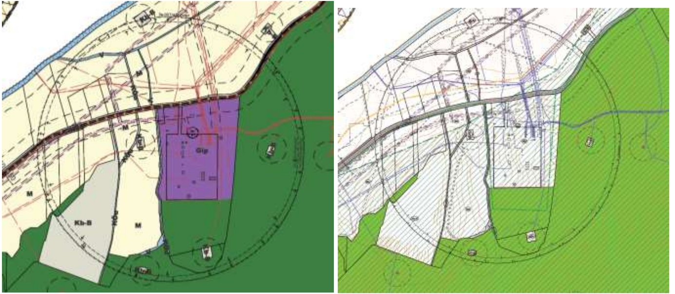
A készülő településfejlesztési- és szabályozási terv a módosuló veszélyességi övezet feltüntetésével

Kérem a Tisztelt Partnereket, hogy véleményezzék a tervezett módosítást.